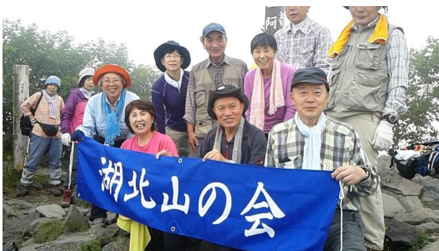
日本百名山・四阿山山頂で（9月）（ご提供写真オリジナル）

基本的に、我孫子から早朝に貸し切りバスで行って、夕方には帰ってきます。うち年に2回ほどは一泊登山になり、山小屋か、麓の温泉宿に泊まります。昨年は青森の岩木山、八甲田山に登り、麓の酸ヶ湯温泉に一泊。もう1回は信州の唐松岳に山小屋一泊しました。今年は秋田の駒ヶ岳、森吉山に登り、田沢湖畔に一泊しました。秋には木曾駒ヶ岳に登り、麓の国民宿舎に泊まる予定です。1回の山行の参加者は40人ほどです。これまで、立山や鳥海山、早池峰山、磐梯山、安達太良山などの百名山の他、鎌倉アルプスとか沼津アルプスなど近郊の低山に計167回の山行を行ってきました。